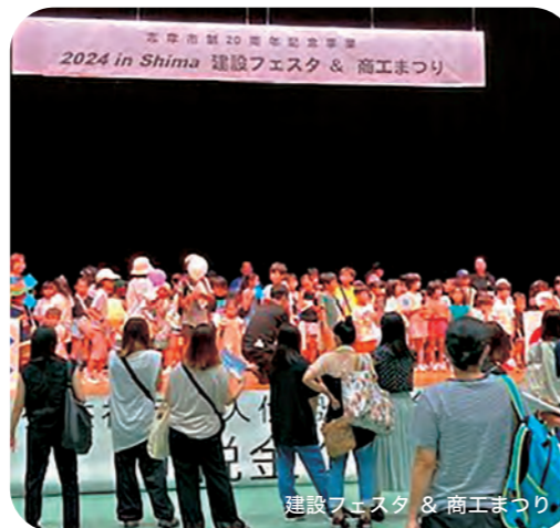
建設フェスタ & 商工まつり