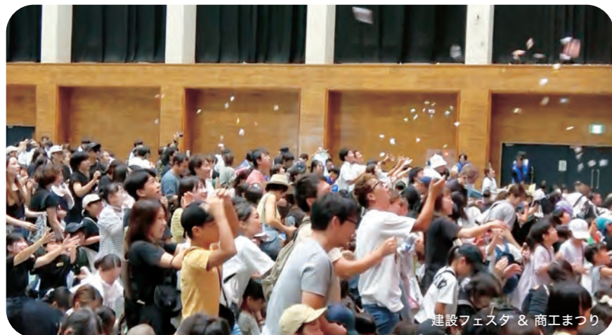
建設フェスタ & 商工まつり