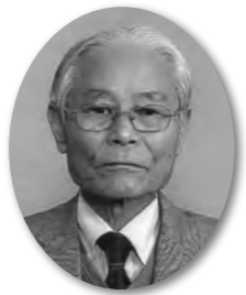
志摩市商工会会長