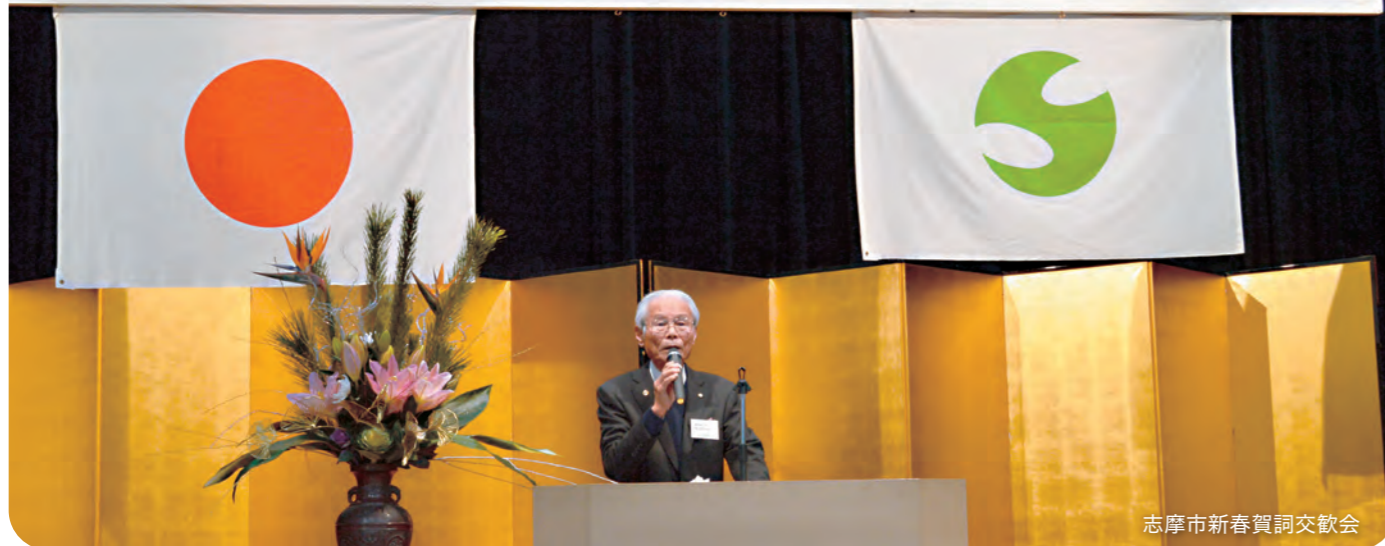
志摩市新春賀詞交歓会